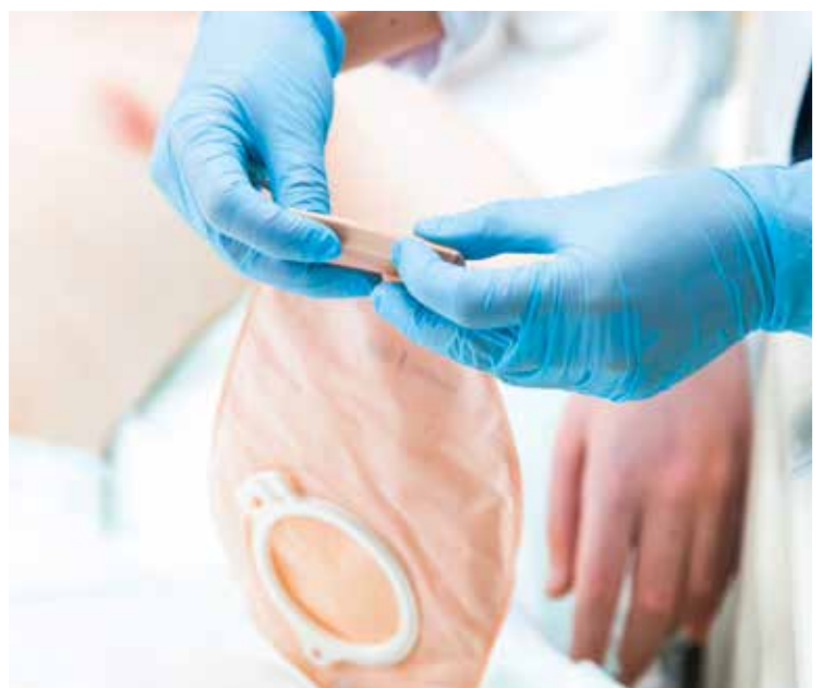
Nach der OP schützt oft ein Stoma, ein künstlicher Darmausgang, vorübergehend die Nahtstelle.